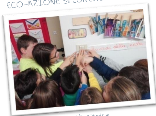
Foto Vincitrice Estraclick III - 2017-18 Album Classe 4° Scuola Collodi - Ar