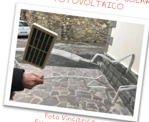
Foto Vincitrice Estraclick V 2017-18 Album Classe 2 B Scuola Masaccio - Ar